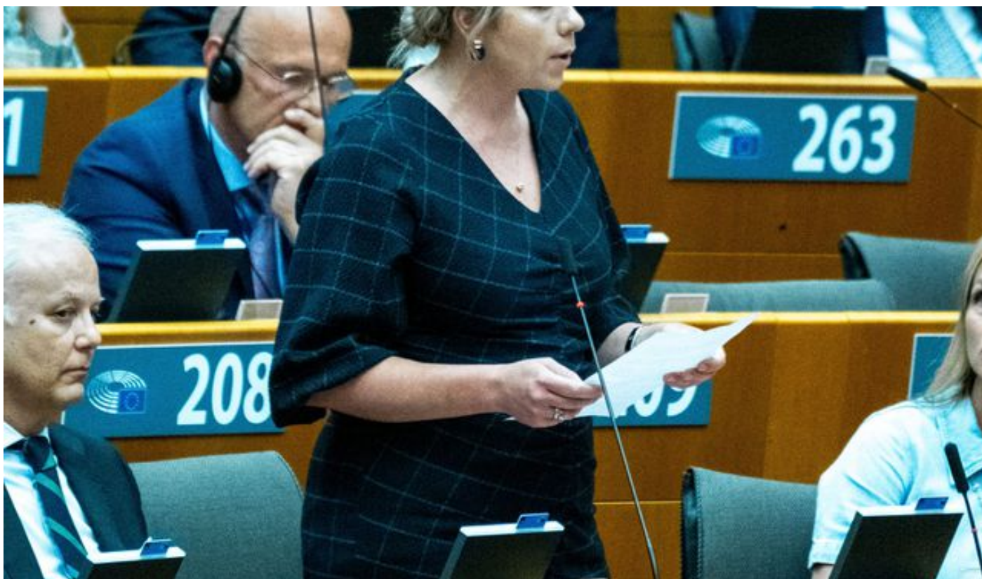
Europarlementariër Marieke Ehlers (PVV) tijdens een plenaire vergadering van het Europees Parlement, in mei 2025.